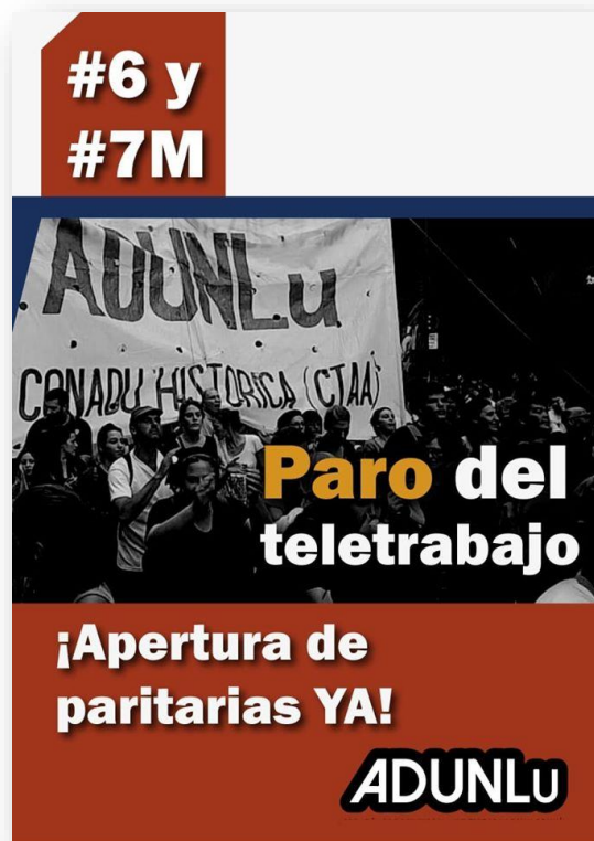
Imagen N° 2. Cartel publicitario de ADUNLu (2020)

El 15 mayo ADUNLu desarrolló una nueva asamblea general extraordinaria. En ella se realizó un balance positivo sobre la huelga del 6 y 7 y de las primeras conquistas obtenidas en la paritaria particular, se ratificó el pliego votado en la anterior asamblea, se defendió la presencialidad como modalidad por excelencia de la educación superior y se avanzó en la elaboración de un documento sobre las condiciones laborales mínimas necesarias para el trabajo docente durante la vigencia de la actual emergencia sanitaria. La redacción final de este documento, por mandato de la propia asamblea, fue elaborada por la Comisión Directiva 18 y elevada como propuesta de la parte trabajadora a la paritaria del sector.